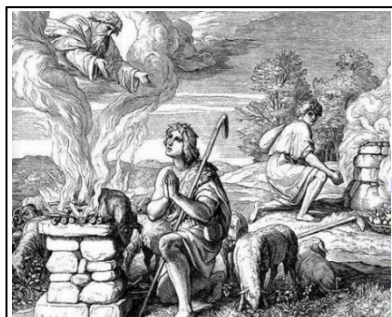
Pela fé Abel foi reconhecido como justo, quando Deus aprovou as suas ofertas (Heb. 11.4)

mo de suicídios, serão efeitos colaterais dentro de certo prazo. Ao longo da história, o que se pôde constatar é que as nações bárbaras a , que não possuíam padrões éticos e morais “avançados”, continham altos níveis de assassinatos e conflitos violentos. No Sudão, até hoje